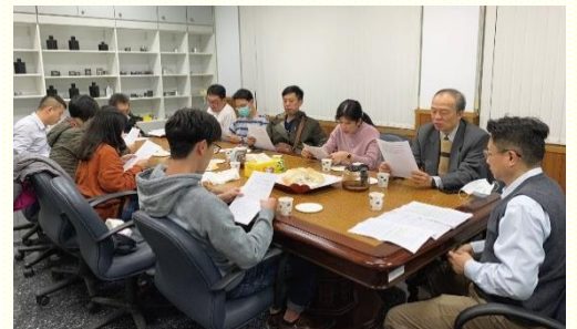
職場排週週追求享受

一位擔任總務的姊妹每週四打電話一一邀請，職場排人數開始恢復。有時聚集人數甚至達十五人左右，且常有福音朋友一同參加。目前每週穩定有十至十五位聖徒和福音朋友前來；藉着聖徒擺上各樣豐富好喫的食物供應他們，每位參與的人得以敞開，彼此分享、關心、代禱，極其喜樂，裏外同得飽足，讚美主的祝福！