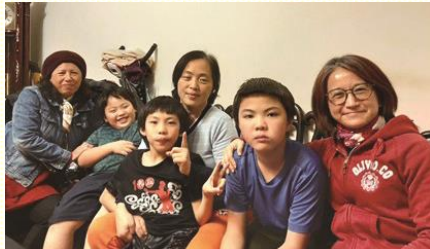
姊妹們配搭福音開展

那天晚上七點，各地前來的聖徒們先到二會所集合，學員們示範如何有效的叩門，並且豫備了一首詩歌：『今