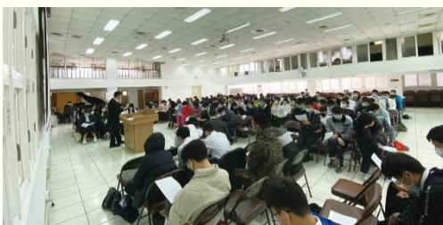
北區期初特會信息交通

自然的就會使我們敬畏主，在每件事上顧到祂並尊重祂，不憑着自己作甚麼，學習信靠祂，享受敬畏神所帶來的神聖分賜。