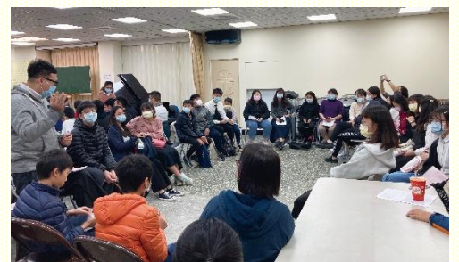
南區期初福音行動分組交通

自然的就會使我們敬畏主，在每件事上顧到祂並尊重祂，不憑着自己作甚麼，學習信靠祂，享受敬畏神所帶來的神聖分賜。