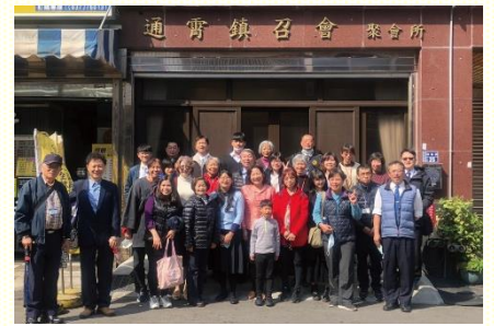
訪問相調會後合照