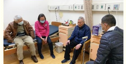
上：到長照中心看望年長聖徒 下：小排中聖徒代禱交通