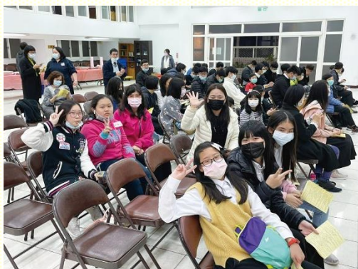
喜樂邀約同學前來

此次聚會有兩點蒙恩，第一是在豫備上，第二是在配搭上。首先，從去年底，青少年組帶領學生們進入代禱小卡