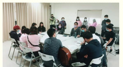
西照顧區的聖徒陳明真理

十二位參與。服事聖徒以體驗活動的方式，帶領青少年、福音朋友進入馬太福音一章十八至二十五節，認識這位『神與我們同在』的主耶穌。