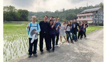
上：在弟兄家中的青職排 下：青職小排戶外相調