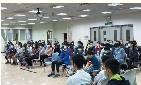
東照顧區的福音聚會