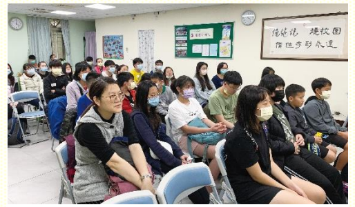
中照顧區的福音聚會