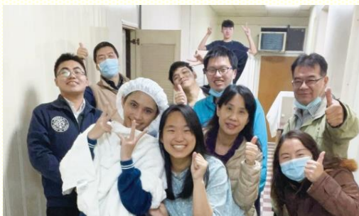
萬能校園藉家聚會得着長期牧養的福音朋友

萬能科大校園，在熱門福音收割之事上蒙恩。這三週我們結了四個果子，皆是已過學期穩定參加校