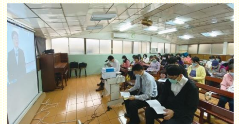
南區會場的視訊交通

接着是二、四、七、八、十二、十六會所的聖徒們，分享建立兒童排、以及公園兒童排得人的蒙恩。每個見證都激勵與會的聖徒們，開排不是一件難的事；只要我們在身體的配搭中，多有禱告、交通，雖然外面會有為難，但裏面有平安，使我們在主的同在與恩典中一同往前。