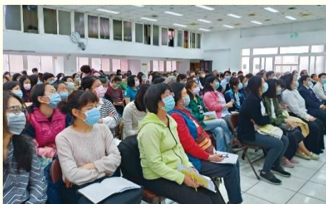
北區會場的視訊交通

全 召會兒童服事者暨家長成全聚會，於三月二十日週六，分別在一會所和二會所連線舉行。