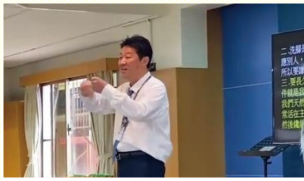
手語聖徒在特會中分享

兄姊妹一同進入這條新路的實行，每逢我們聚在一起操練牧養人，無論在家聚會、排聚會、或更大的聚會裏，