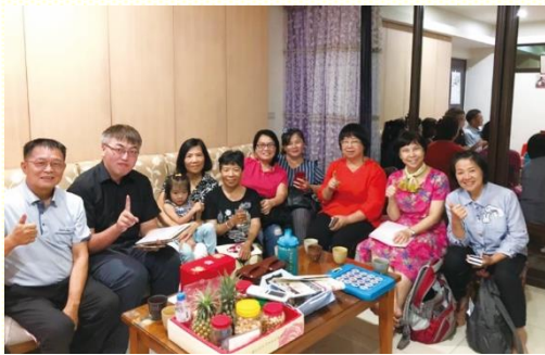
探訪恢復姊妹及家人的聚會情形

接着九月十八日到二十二日，桃園、苗栗的同工弟兄們到馬祖訪問，對於北竿、南竿要來的壯年班