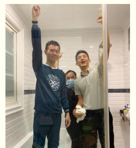
十六會所歡喜得人

感謝主，在弟兄姊妹的代禱與扶持中，重劃區正式成立了新的小區，能就近邀約、大量接觸這地的居民。而這週的主日聚會，我們邀到多位新人同來擘餅，帶進基督的身體裏，並使他們彼此建立關係。還意外發現，有兩位新人曾是老鄰居，