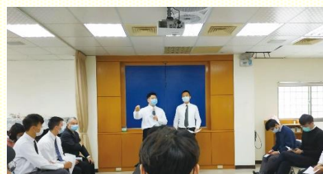
青職聖徒相調聚會

熟，卻叫不出名字。藉着相調，幫助眾人經歷被調和、調整，而放下天然的感覺。如同保羅在林後六章所說的：『哥林多人哪，…；在我們裏面，你們並不受限制，你們乃是限制在自己的心腸裏』。我們若是封閉的，甚或抗拒相調，實在是把自己給限制住了！弟兄們在會中題醒，要彼此關切生活中各面大小的需要。此話真的不錯，若不清楚聖徒具體的光景，如何能彼此相愛呢？願藉此集調，更顯基督身體中，彼此相愛的實際。