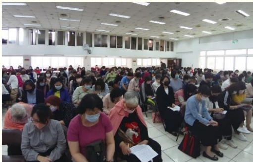
在一會所的聚會情景

全 召會姊妹相調特會北區場，於四月二十四日上午在一會所舉行，進入春季國際長老及負責弟兄訓練的信息。本次特會共有二百六十位姊妹到會，以及十三位弟兄配搭服事。