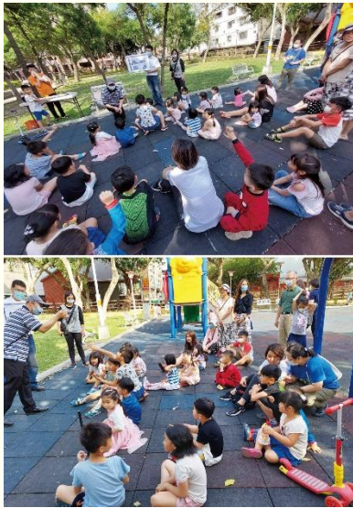
公園兒童排中講說故事

四月份，因着在八德重劃區的開展，幾位弟兄們前去配搭，順便觀摩公園兒童排的實行。之後將負擔帶回來交通，大家覺得作兒童排接觸家長，可進一步回訪，甚至到家中講故事，是一條可以實行的路，於是開始着手規劃。因為已過曾在溫州公園唱詩歌，並在周邊發汽球接觸人；那裏的居民無論孩子、家長，少有拒絕的情形，也願意與我們有些交談。經考量每位聖徒曾去該公園傳福音的情形，弟兄們決定四月二十四日，就在溫州公園開始第一次的