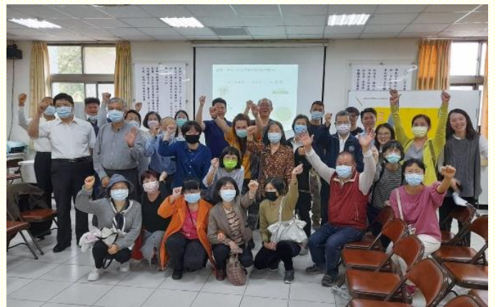
聖徒喜樂配搭開展

此次叩訪近一萬多戶，約楊梅總戶數的六分之一，其中有些是不在家者，應門戶數共二千七百多戶。叩門加上馬路福音，共傳講一千五百位，而有二百五十多位呼求主。另外，每週三、日在社區