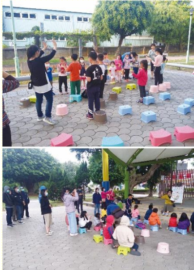
公園兒童福音行動

本會所新富區在兒童這一環特別蒙福，有四個兒童排，卻不以此為滿足而停滯不前。因着其中很多成員是弟兄姊妹的孩子，作為固定班底；當小孩升上青少年，發現兒童人數有遞減的趨勢，聖徒便有感覺需要加強傳揚福音，走出去開展得新人。讓兒童排能成為得人的魚場；不僅吸引家長，使他們體會兒童性格的重要，進而認識召會是養成兒童正確性格的好環境。