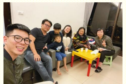
學員配搭送會到家

三個會所七百零一人次，合計一千七百五十六參加人次。結果共得救三十一位新人，實行三十四個家聚會，帶領十五位福音朋友與新浸聖徒進入主日聚會，以及成立一個新的區。