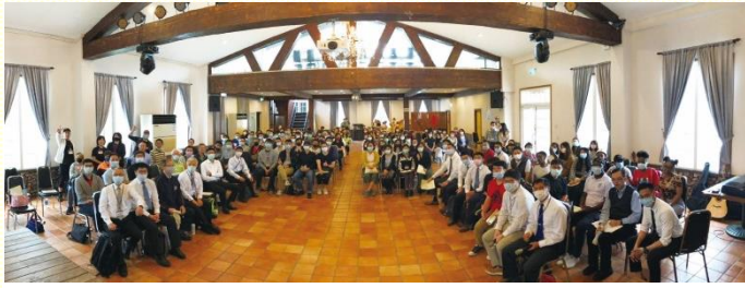
南區青職相調聚集

着，在分組的操練中，眾人一同禱讀，以團體的方式把主作為那是靈的話，接受進來。不同於已往特會的信息傳輸，此次相調聚集是更滿了享受的筵席，一個滿了『契』的聚集。