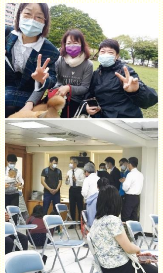
公園接觸人並帶回會所

然而大家對建立新路之福的架構，其信心與決心沒有改變；反而運用智慧，改以和敞開的福音朋友作線上家聚會。弟兄們還請每位聖徒列出三十人福音名單（含家人、同事、朋友），每週二每人打電話關心至少一、兩位，並持續為他們代禱。相信在疫情管制結束後，眾人仍能堅定持續週週外出傳福音，且要一直走下去，直等到我們所愛的主回來！願主祝福並成全我們的心願。