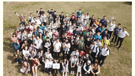
北區青職相調喜樂合影

到了中午，眾人就在園區裏一同烤肉，並與不同會所的聖徒多有交通認識。一面我們喫得喜樂暢快，另一面也在身體裏得顧惜，同建造。喫喝飽足後，大家在園區內大草皮有相調活動，其目的是使眾人更多互動，以加深各會所弟兄姊妹的認識。服事者安排的活動有兩個遊戲，第一個是比手畫腳；遊戲過程使我們學習作一個能正確傳達訊息的人，也認識每個人在隊伍中都是很重要的角色；