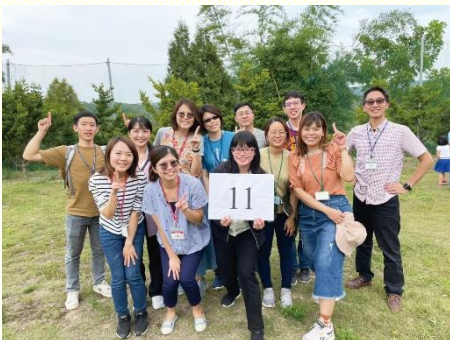
參加青職相調喜樂合照

已往在報名的作業上，青職服事聯絡人總會攬起來作，覺得自己處理比較快；但因着那段時間，他的工作忙