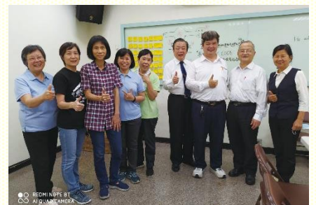
壯年班學員和輔訓前來配搭開展

這次壯年班的弟兄姊妹來加強、扶持我們；也藉着弟兄的車輛服事，使小子能抓住機會，每天下午和晚上都跟隨羊羣