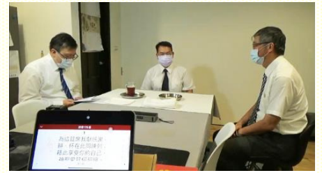
主日擘餅聚會直播

除了禱告聚會，在主日聚會方面，每逢主日早晨，少數弟兄們就在一處有實體擘餅聚會；而透過線上直播，使聖徒靈裏見證耶穌是主，同在一個身體裏記念主、敬拜父。總是『不可放棄我們自己的聚集』，並且主應許『無論在那裏，有兩三個人被聚集到我的名裏，那裏就有我在他們中間』(太十八 20)。因此年初的主日平均人數為九十人，到六月的線上主日人數突破一百位；聖徒們雖處在為難環境中，仍然喜樂的有分於主的桌子。