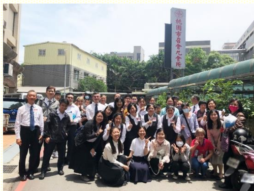
壯年班與九會所聖徒合影

本次叩訪的區域，含括中壢體育園區及其鄰近社區，是六會所與九會所重疊的區域。因着大部分是未開展過的