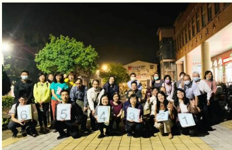
編組成軍準備出發

三月二十九日到五月二日有八德重劃區的五週開展，我們除加強原有之福音架構，更是積極前往配搭，全程參與的聖徒共計六十一人次，超過原來的豫期。因排定第一次的配搭時間，與各區小排及兒童