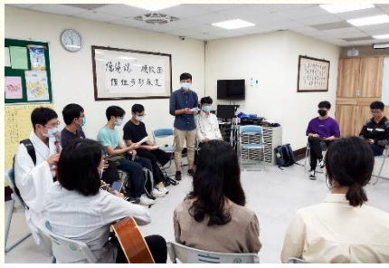
中原弟兄傳講福音

需要逆流而上，所以雖舉步維艱，仍要爭戰着向前；因為沒有別的選擇，為着主的緣故必須爭戰，好在校園中產生傳福音的負擔。