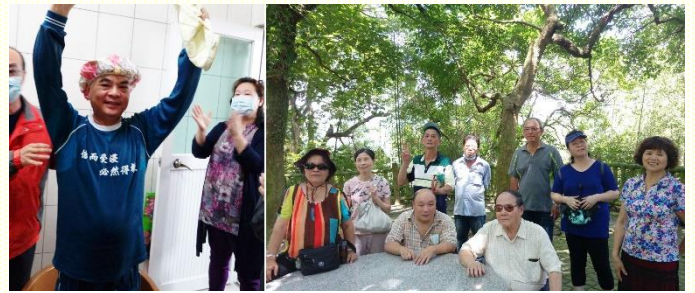
年長聖徒喜樂得救並一同外出相調

此外，聖徒們也從屬靈書報中得着益處。一位聖徒，家逢巨變，哀痛逾恆，不知道神的旨意為何