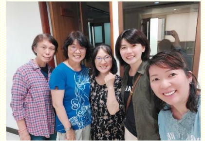
傳福音前喜樂合照