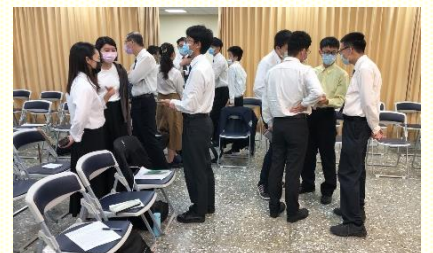
豫備聚會學生分組交通

最後分別有高中和大學服事者給予負擔的話，盼望每一位青年聖徒以神聖的眼光，衡量要來的大學生活，有清楚的異象好贖回光陰。特別勸勉青年人，全心渴慕只過一種生活，如林前六章十二