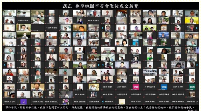
聖徒成全期末展覽線上大合照

在聖經研讀分享後，接着是分班成全見證。在新路班，有新路實行的相關信息開啓，也有福家