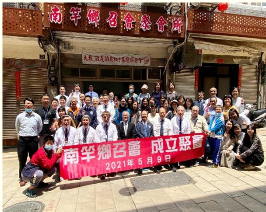
南竿鄉召會成立聚會合影

到了二〇一〇年代，神興起在主恢復裏聚會的聖徒，從臺灣來到馬祖工作，其中以桃園的聖徒