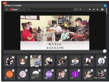
青少年心愛詩歌訪談

藉這樣遠端視訊的分享，與每位與會者線上互動，真是縮短了人與人之間的距離。甚至有八位以上的福音朋友，連續四週參與線