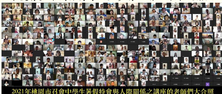
2021年桃園市召會中學生暑假特會與人際關係之講座的老師們大合照

藉着對主話的享受、對人際關係的認識；在特會的最後一天，分組操練使用詩歌 254 首『我今飲於永不乾涸的活泉』及約翰福音第七章的聖經故事『乾渴人的需要——生命的解渴』，舉辦線上福