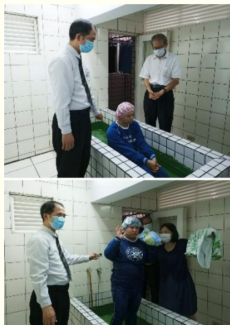
五月十五日兩位姊妹受浸