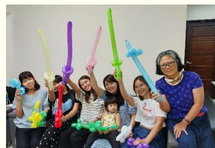
疫情前在我家有美勞實作、英文共學、聖經故事等的親子聚會

在福音方面的操練，這些年我們在居住的所在地，推廣親子品格教育，推動共學共讀，以此接觸青職家庭，並邀請家長一同來關心下一代的教育。在這樣的過程中，十分經歷福音是生活化的；透過每週小型的家庭聚會，說故事、學英文或作美勞，邀請