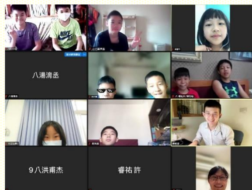
青少年線上讀經追求