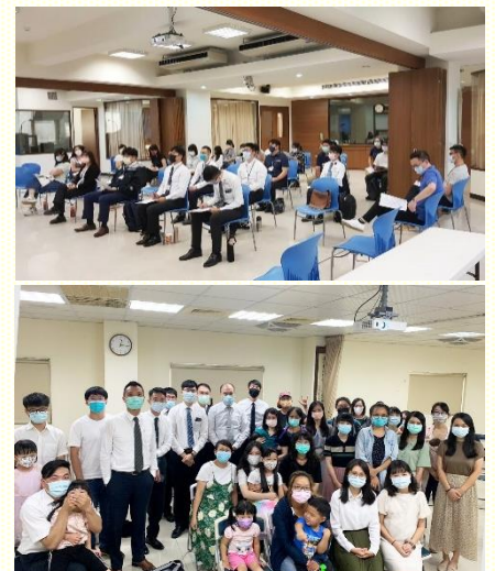
北區與南區青職特會

南區青職聖徒在這次特會配搭中，一次又一次的交通和禱告，使眾人更加同心合意。藉着在各場地同步進行，每一位弟兄姊妹都能在實體聚會中得着益處。特會中交通到，現今我們都身在主的