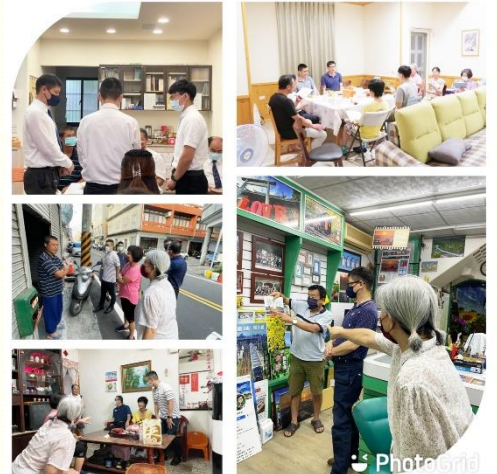
主日擘餅聚會、看望、福音愛筵

另有一次看望，看到福音朋友帶着孩子從外地回娘家相聚，桌上擺滿菜餚，看見我們到訪就熱情邀約一起用餐。當我們簡單問候要離去時，福