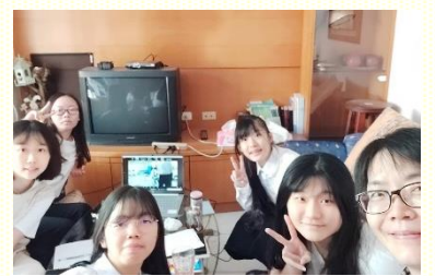
醫專期初特會主日合影

僅僅作一個所謂的好基督徒，過一種在人看來相當完全的生活，根本是不彀的。當神在祂的歷史中行動並奮力活動時，我們必須與神是一。