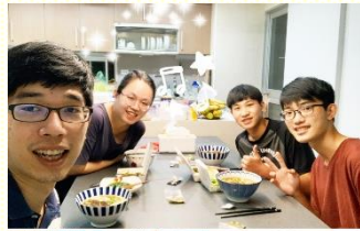
聖徒與大專生用餐交通

近期由於疫情趨緩，就有機會邀請大專生一同用餐交通。按着活力排原則實行，一組一組的顧到兩、三個人。在九月開學前夕，邀請大專生在餐