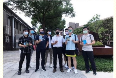
聯合開展傳校園福音