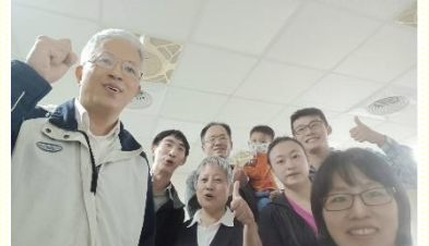
一同配搭福音出訪

感謝主！新路不是一條便宜、快速的路，相反的，需要眾聖徒花上代價。藉着一邊實行新路、傳揚福音，一邊跟隨活力排的帶領；加上填寫聖徒成全的生活操練表，把眾人規律到靈裏，時常為基督所加強。當不斷來到主面前有享受，傳福音不再只是外面的行動；而是因着接觸主，得加強，有負擔，持續不斷的出外湧流。