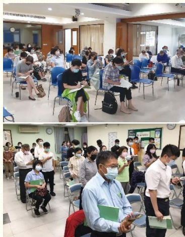
北區與南區參加特會實況

特會的總題是『應付神的需要和主恢復中當前的需要』。共八篇信息，第一、二篇是關於神的需要，第三至八篇是關於主恢復當前的需要。第一篇即給我們看見神在今時代的需要；神需要人與祂合作，好恢復地並結束這世代，我們需要成為得勝者，完成祂時代的