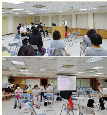
福音聚會現場實況

這天是本會所開始恢復月月福音聚會的第一場，感謝主給了我們一個榮耀的起頭。實體聚會連同線上的參加人數超過七十位，福音朋友共九位參加。配搭服事聚會的弟兄姊妹都生機的盡功用，各小區聖徒也積極參與聚會，讓眾人對於恢復傳福音的實行士氣大振。弟兄們更着手豫備，接下來兩個月福