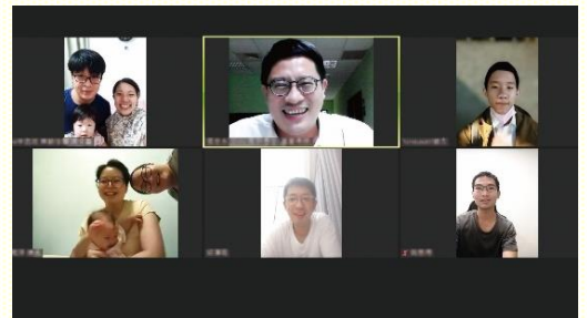
線上共同追求合照

但不在神格上成為神。為此神需要經過過程，包含成為肉體、人性生活、釘死十架、復活、升天等過程，如今祂成了包羅萬有、複合、賜生命的靈，分賜到所有相信祂的人裏，使我們的靈被點活、得重生並且與主成為一靈。祂復活成為神的長子，同時生了我們成為神的眾子，使祂能在所有弟兄中作長子，我們這些神的眾子能構成為基督的身體。今天操練憑着基督復活的大能過模成基督之死的團體生活，這生活也是神人的生活，就是基督身體的實際。