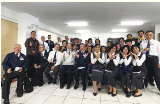
與壯年班聖徒合影

在壯年班弟兄姊妹來到之前，我們就先與他們建立了守望禱告的羣組，眾人同心合意為福音朋友名