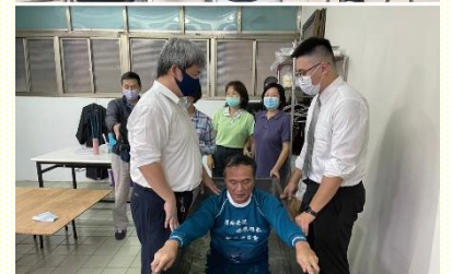
福音聚會並領人歸主