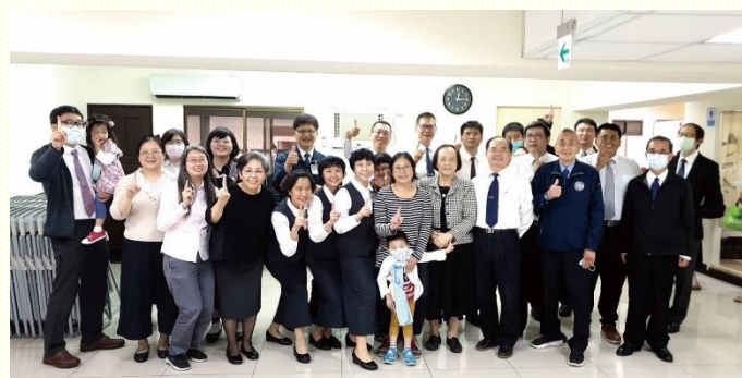
聖徒與壯年班學員合影

因着這段時間疫情趨緩，我們申請了壯年班學員前來配搭開展，盼望藉着身體的行動，能讓福音的熱火，燒着每一位聖徒。隨着日子的接近，眾