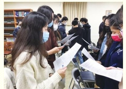
聚會中追求與奉獻

在信息交通後，邀請參加過訓練的兩位聖徒及一個家，來向大家見證，參加訓練帶給他們在求學、職場工作的幫助。我們的主從來不誤事，這幾