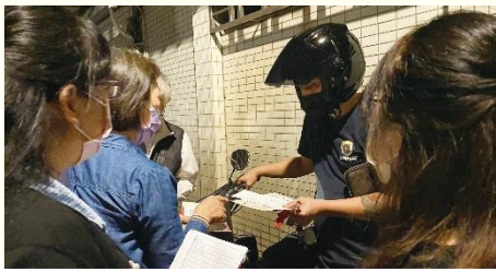
路邊接觸人傳福音

眾人在作中學，學中作，實行上脫舊更新，身體中受成全，培養接觸人的性能。若接觸到年長的人，需