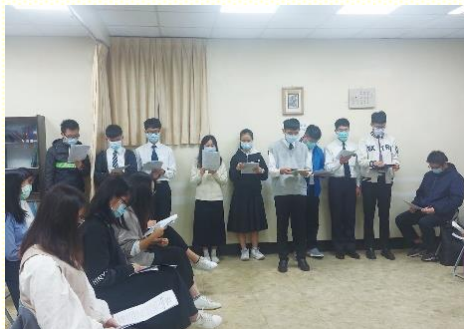
期中特會分組展覽

今年大專期中特會於十一月十二日至十三日舉行，共有三十七位大專生參加。特會的總題是：『聖經的心臟—加拉太書』，共有四篇信息。藉着服事的弟兄們帶領大專生進入加拉太書，操練講說主題與綱目，並禱讀重要經節，主的話就更多作到他們裏面。其中第二篇和第三篇，由大專生分組豫備展覽，使他們藉查讀經節出處，深入探究真理，並操練將所研讀的展覽出來。