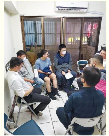
福音聚會分組討論

以弗所書三章八節：『這恩典賜給了我這比眾聖徒中最小者還小的，叫我將基督那追測不盡的豐富，當作福音傳給外邦人』。感謝主，願藉每次的福音聚會，都將這位包羅萬有、追測不盡的基督，當作福音展覽出來，使世人也能一同享受基督的豐富。