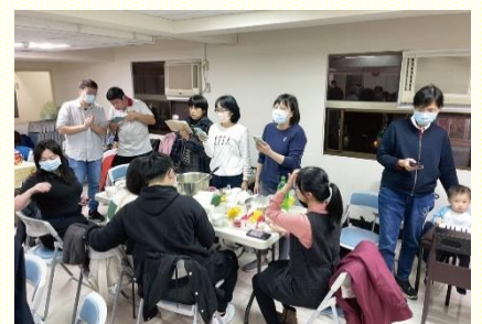
十一、十三會所青職福音