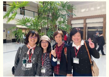
聖徒參加特會合影

有位姊妹第一次參加大型特會，享受三一神全備的供應，嘗到神的愛、主耶穌的恩典、聖靈的交通，深受感動，願意以後都要參加。另一位姊妹摸着復活的