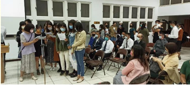
青職姊妹們上臺分享

另有人見證因着這樣的晚禱，不僅對高峯真理有清楚的認識，更有負擔在生活中實行所看見的亮光，操練過神人的生活，使真理不再是知識道理，而是能殼應用、實行並成為實際的經歷。還有的弟兄姊妹平常在外地，也藉着線上晚禱，能與大