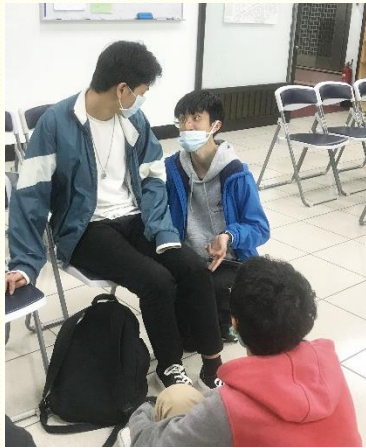
同儕之間的關懷有效能

首先我們加強住在弟兄姊妹之家的學生們，使他們有負擔（但非重擔）；我們認知，惟有學生本身纔容易帶同學們來聽福音。社區的聖徒則加強服事這些中幹學生，藉着愛筵，關心、鼓勵，並餵養他們。學生聖徒果然接受負擔，一個一個加入配搭，為着福音齊心努力。在十二月一日晚上的福音聚會，包括電器服事、見證及短講，都由學生弟兄來配搭。十二月十五日的第二次福音聚會，邀約同學、帶詩歌、作見證皆有學生參與。主祝福我們的同心合意，終於帶領一位學生受浸得救，眾人齊歡欣感謝主。