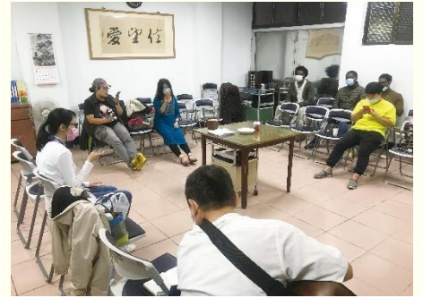
主日夜間擘餅記念主

至於對元智大學外語聖徒的照顧，在疫情嚴重之前，本會所興仁區每主日有夜間擘餅及外語小排，那時到會的外語生較多，約五