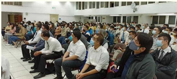
青職追求李常受文集展覽聚會

今年九月全臺青職特會時，交通了特別的負擔，就是花一年時間追求李常受文集一九九四～一九九七的信息，這對青職聖徒是個大挑戰。臺北的青職聖徒從十月開始，每天晚上即有追求李常受文集一九九四～一九九七的晚禱實行。桃園的弟兄們希望也能一同蒙恩，跟上時代的水流，