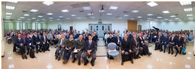
秋季聖徒成全期末展覽大合照

當天展覽的內容，包含聖經研讀及各分班成全的蒙恩見證。藉着追求研讀以西結書，使我們看見主榮耀異象的顯現，並且經歷神作烈火來審判；最後，神卻是藉着生命來恢復，把我們帶進聖別的建造裏。有位姊妹說到，她何時不在靈裏，就是死沉、枯乾的；但藉由弟兄們釋放神的話語，她再次被點活了；也使我们這些枯乾的骸骨站起來成為極大的軍隊。另有一位姊妹