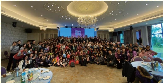
年終數算主恩暨展望聚會合影

因為愛主,我們相聚在一起,訴說恩典、安慰和鼓勵。這次數算主恩聚會由這首詩歌揭開了序幕,藉由兒童排、萬能科大、青埔區的介紹,進入各小區的展覽與分享。從外面來看,去年是非常艱辛嚴峻的一年;許多弟兄姊妹分享,已過一年如何在為難環境中,經歷主的恩典與加力;有收入銳減影響生計的,有生病、發生意外的,從人的角度