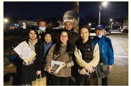
配搭五週福音開展行動