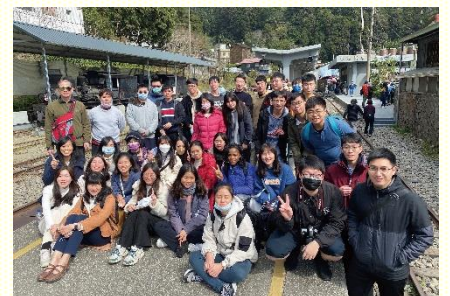
奮起湖車站大合照

一月十六日的主日擘餅後，出發往嘉義。第一站是曙光有機玫瑰園，弟兄專業的導覽講解，融入了神聖的啓示，從神的