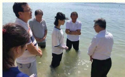
為二位姊妹在海邊施浸

二〇一九年十一月兩位海外弟兄前去訪問，與聖徒們有美好的相調。在來訪弟兄的幫助下，不同語言的弟兄們開始來在一起禱告交通，盼望藉着更多享受、相調、建造，建立服事核心並豫備成立召會。其中一場相調聚會有兩位福音朋友參加，他們深受感動，會後主動表示願意受浸。隔天兩人