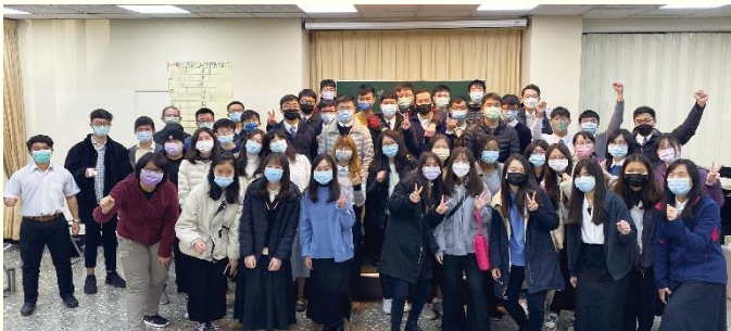
大專期末特會於二會所舉行

此 次大專期末特會於一月十四至十七日舉行，共有五十三位學生參加。前兩天在二會所有信息交通，後兩天前往嘉義相調。