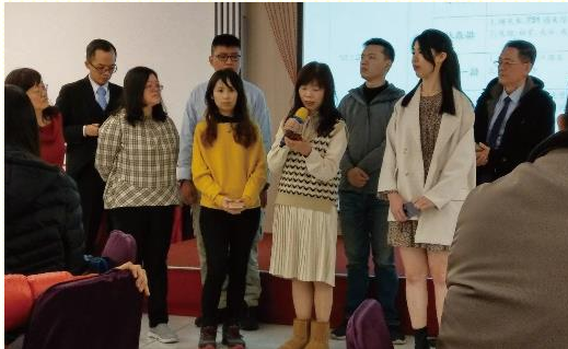
青職排聖徒分享家聚會讀經餵養

第一，家聚會餵養：因着傳福音，尋回一位失落已久的小羊，此後小羊週週聚會，與我們同過正常的召會生活。她需要規律喫喝，生命纔會長大，因此相約一同讀經。一陣子之後，感覺青職需要同伴，於是邀請另一位青職姊妹加入。同時也想讓青職聖徒和社區排多相調，就又邀了一位社區排姊妹參加。果真四人讀經就比先前豐富許多，每次讀完都會有一些簡短交通，自然大家就熟悉，出外相調時也覺得格外親切。這樣的讀經追求，一年下來累積許多豐富的話語，更使小羊穩定在召會生活中，成長茁壯。