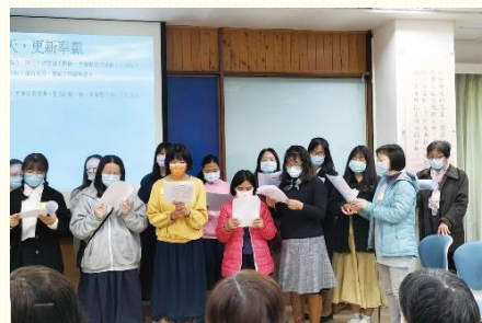
年終感恩聚會青少年與服事者展覽

還有，去年十二月下旬東照顧區的青少年福音聚會，本會所參加人數有八十三位，其中青少年弟兄姊妹二十四位，