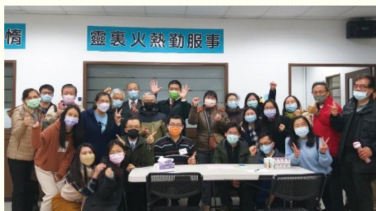
福音聚會得救新人與聖徒們合影

每天下午的馬路福音，以及晚上的叩門福音，各有一個半小時的禱告和出訪，配合四次福音收割的行動。五週下來，十