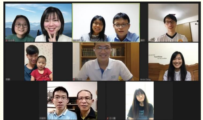
線上共同追求合照

自去年十二月五日，則開始『一九九四～一九九七年李常受文集』的追求。固定每天晚上九點四十五分線上閱讀，一同跟上高峯真理的追求。已實行近三個月，目前有七位青職聖徒、四位中壯聖徒，在線上共同追求。個人自己的追求，容易懈怠，無法長久；但在身體中彼此題醒、扶持，就能毅堅定持續的享受主的話，使我們明白主話語的啓示，並被高峯的真理所構成！