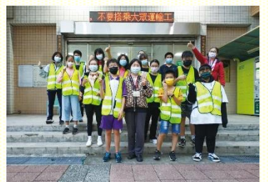
社區公共服務喜樂合照

大約下午四點，有兩位清潔工作的叔叔，拿出背心和清潔工具準備就緒，如竹掃把、掃帚、畚斗、推車上放置垃圾桶。人員分兩組、兩條路線，沿着文化國小圍牆的人行步道打掃。叔叔很高興有這些幫手，他將平日不易清潔的落葉和穢物用鐵耙掃出，有人以竹掃把掃向圍牆，其他人用掃帚集中，另有人用畚斗裝起倒入垃圾袋，一下子一袋就滿了。看着得榮少年們從漫不經心到認真合作，路過的行人都好奇：怎會有如此熱心的少年在作社區服務？他們都很稱讚。