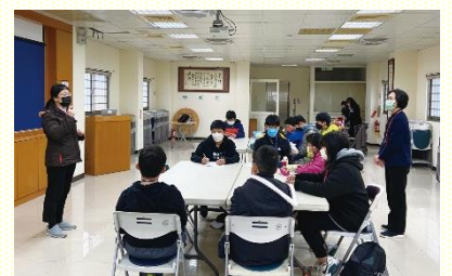
生命教育體驗課程

我們在社區至少辦過三個梯次的課程，通常是兩個週六，上午三堂、下午三堂，密集的進入十二堂課。在課程結束後，總有孩子問我：『老師，下週還可以再來上課麼？』我告訴他，體驗課程上完了，但接下來還有快樂學習和其他活動，