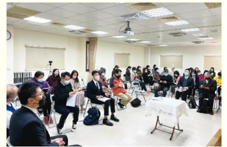
十會所集中主日聚會

次日是十會所的集中主日，延續事奉相調的重點負擔，我們交通到本會所生活圈規劃願景、區排架構調整和生活圈內的開展