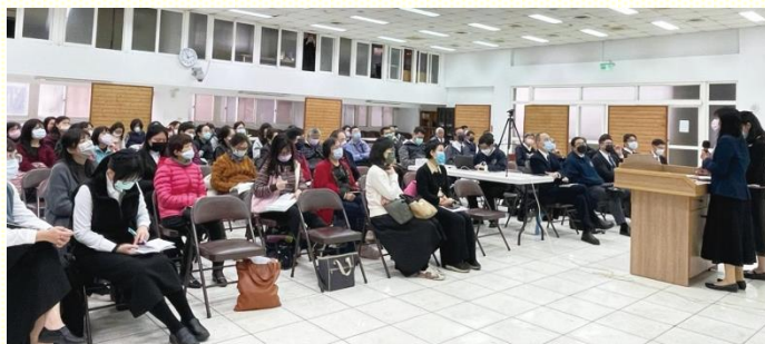
兒童排開拓事奉交通聚會

弟兄們題醒，已過姊妹開兒童排，往往一開排就深陷其中，無法分身再照顧其他的排。我們要更新異象，成全年輕的媽媽，只要有孩子的就可以家打開成立兒童排。在初期，先與自己的小孩建立家