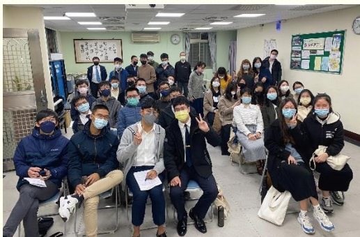
學生們於會後合影

特會中弟兄向我們陳明，這位神人耶穌基督是神福音的中心，神的福音乃是神在已過永遠的計畫中，並藉着祂的申言者所多方應許的。基督的福音