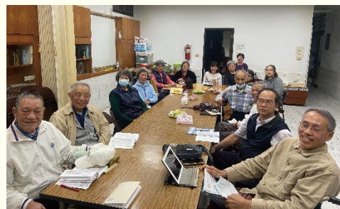
佳安小排恢復聚會

活。藉着小排生活托住現有的弟兄姊妹，挽回久不聚會的聖徒；也推動在家中傳福音，帶進人數的繁增。