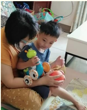
姊妹家中的家庭時光

其中有一個家，姊妹與孩子一直習慣在睡前說故事，並在關燈後談心和晚禱。已往故事的題材多來自於繪本，但因着參加兒童服事的交通聚會，靈裏有感覺需要找與聖經相關的材料與兒子共讀。近日閱讀『性格的培養』這本書，雖內容遣詞用字對