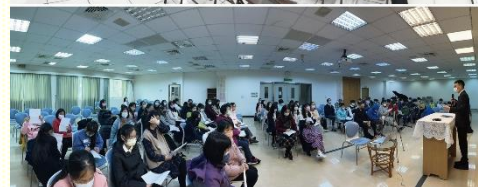
北區與南區的中學生期初特會